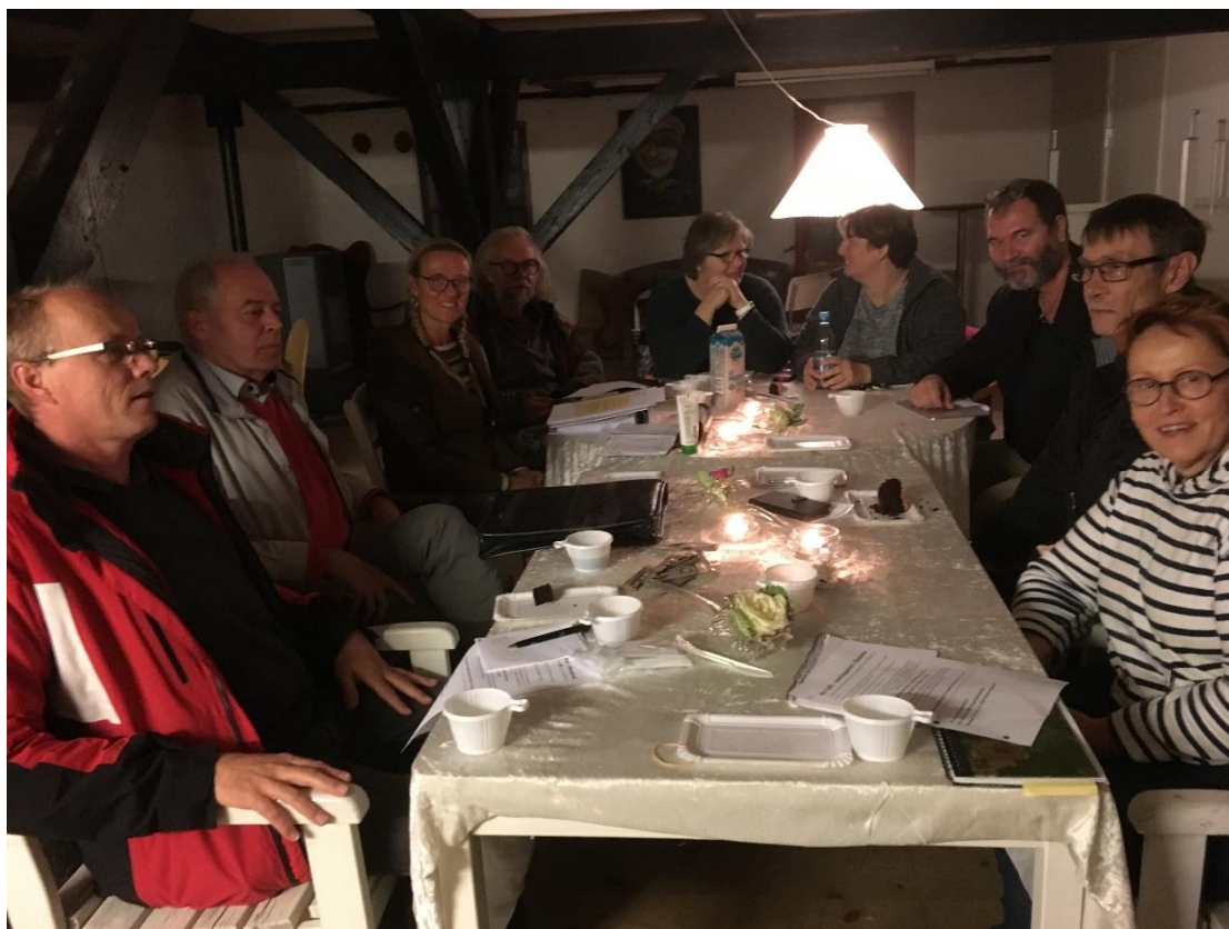
Fra planlægningsmødet om den nye menighedspleje for Sandved og Omegn2

Det første mål er at oprette en café i Sandved for beboerne. Sogdenes menighedsråd står bag, at der stiftes en menighedspleje, hvor bestyrelsen foruden repræsentanter for menighedsrådene også får repræsentanter med fra den lokale borgerforening, fra den lokale hal og fra Lokalrådet. Man er allerede i gang med planlægning og formøder. Eftersom de to pastorater ligger på hver sin side af den vej, der går midt igennem Sandved, ser man den fælles menighedspleje som en forening, der i høj grad kan være med til at skabe fællesskab mellem sognene og borgerne på det sociale område. Der er også planerne om senere at gå i gang med en besøgstjeneste.