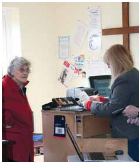
Der er åbnet postkontor i en metodistkirke på landet i Weaverthorpe.

Noget af det, som jeg har bidt mærke i ved de initiativer jeg har hørt om, og det materiale jeg har set, er den meget grundige forberedelse, som går forud,