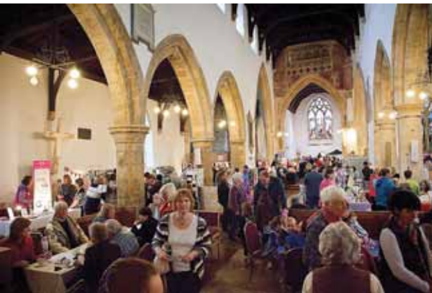
I St. Peter's Church i et landområde i Oxfordshire afholdes der håndarbejdsmarked

folk. Bøn er en anden vigtig del af det forberedende arbejde, for det holder alle skarpe på, hvorfor det overhovedet er, man føler sig kaldet til at gøre noget som helst, og er også det sted, hvorfra benzinen til at fortsætte skal komme, når der melder sig uforudsete udfordringer.