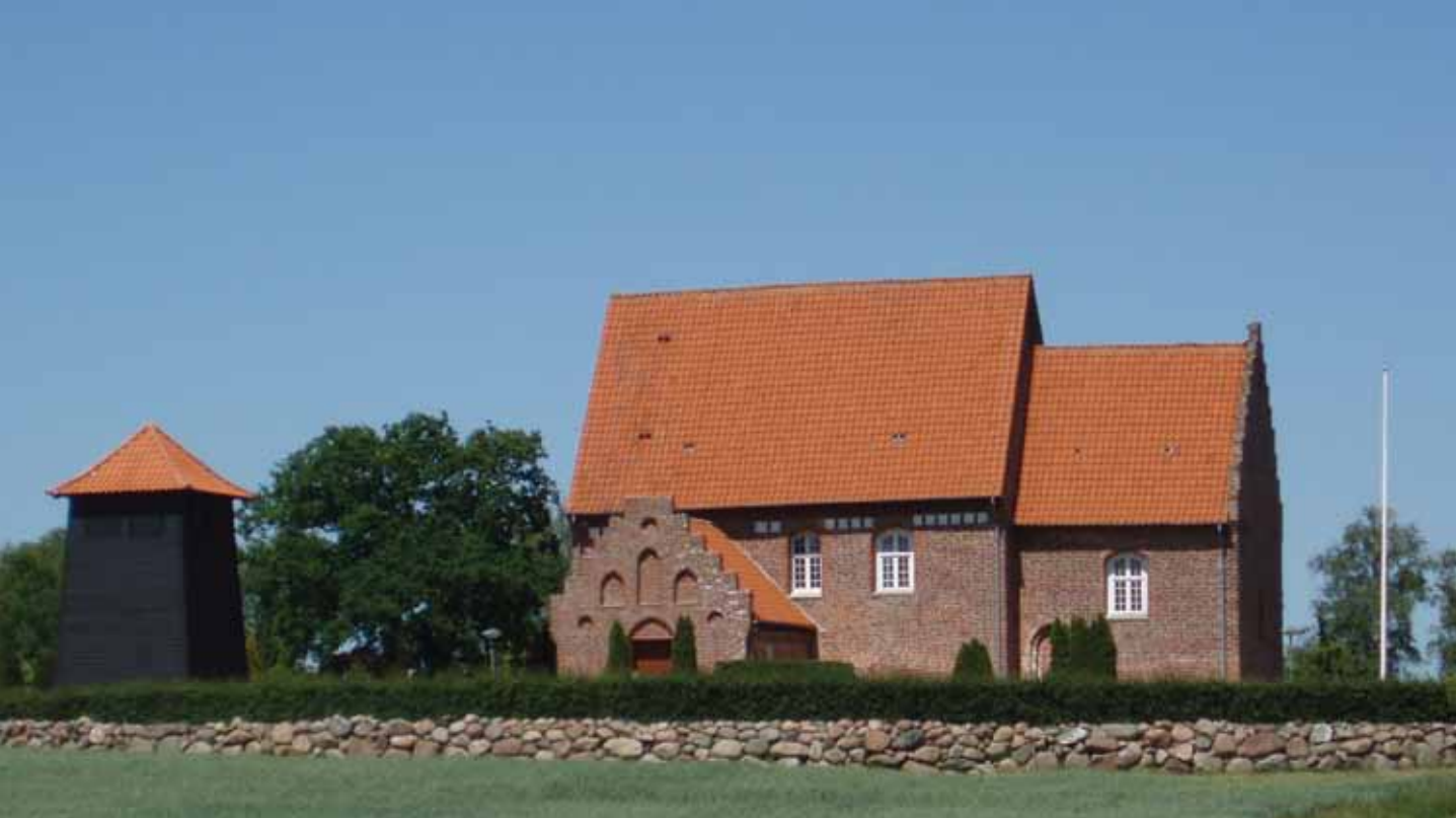
Kirken i Holeby.

sygdomsramte. De frivillige tilknyttes tit et menneske, der ikke bor så langt væk, men somme tider passer det bedre at matche med en frivillig, der har et stykke vej at køre ud til sin vært, og det er ikke et problem. Der gøres meget ud af PR for tjenesten, idet der foruden i kirkerne ligger brochurer fremme hos lægerne, på ældrecentret og hos købmanden.